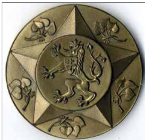
Ryc. 11. Awers i rewers medalu: VENUJE STATNI VYBOR PRO TELESNOU VYCHOVU A SPORT PRAHA. Zbiory MAH w Stargardzie, nr inw. MS/H/2833