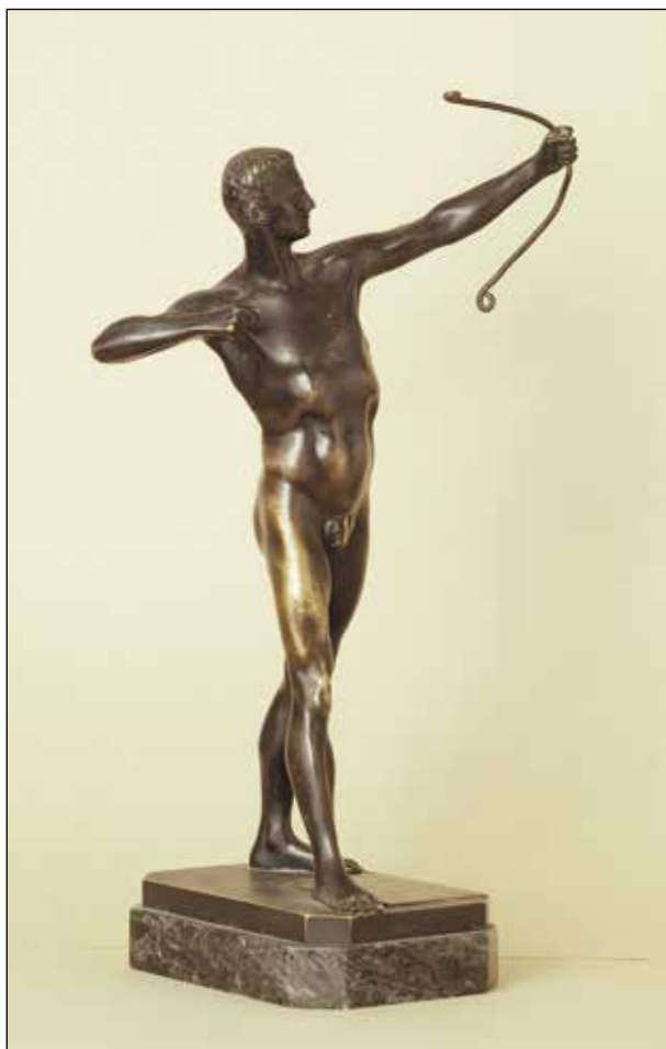
Ryc. 21. Statuetka. Zbiory MAH w Stargardzie, nr inw. MS/S/1307.