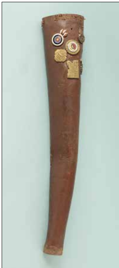
Ryc. 10. Kolczan na strzały łucznicze. Zbiory MAH w Stargardzie, nr inw. MS/H/2830.