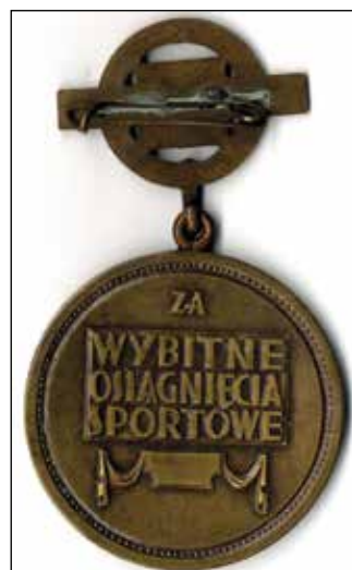
Ryc. 19. Awers i rewers medalu: ZA/WYBITNE/OSIĄGNIĘCIA/SPORTOWE. Zbiory MAH w Stargardzie, nr inw. MS/H/2841