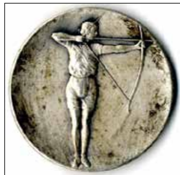
Ryc. 18. Awers i rewers medalu: XX/Łucznice/M.P./1956 r. Zbiory MAH w Stargardzie, nr inw. MS/H/2840