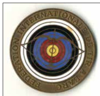
Ryc. 13. Awers i rewers medalu: FEDERATION INTERNATIONALE DE TIR A L'ARC, 1955/HELSINKI/ GRAND TOTAL/LADIES TEAM/III P. Zbiory MAH w Stargardzie, nr inw. MS/H/2835