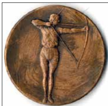
Ryc. 16. Awers i rewers medalu: XX/Lucznice/M.P./1956 r. Zbiory MAH w Stargardzie, nr inw. MS/H/2838