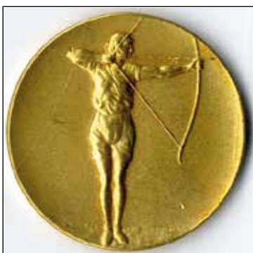
Ryc. 17. Awers i rewers medalu: XX/Lucznice/M.P./1956 r. Zbiory MAH w Stargardzie, nr inw. MS/H/2839