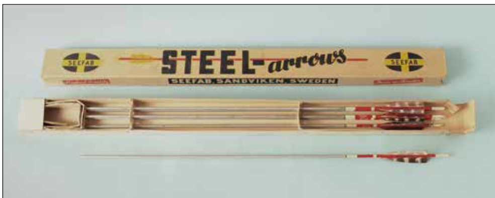
Ryc. 9. Zestaw strzał luczniczych firmy Seefab. Zbiory MAH w Stargardzie, nr inw. MS/H/2832.