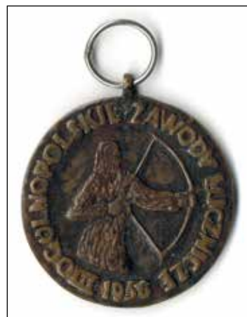
Ryc. 12. Awers i rewers medalu: III OGÓLNOPOLSKIE ZAWODY ŁUCZNICZE 1956/O PUCHAR ZIEMI LUBUSKIEJ W GORZOWIE, 1956 r. Zbiory MAH w Stargardzie, nr inw. MS/H/2834