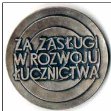
Ryc. 20. Awers i rewers medalu: ZA ZASŁUGI W ROZWOJU ŁUCZNICTWA, 1927-1977 POLSKI ZWIĄZEK ŁUCZNICZY. Zbiory MAH w Stargardzie, nr inw. MS/H/2842