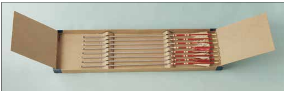
Ryc. 8. Zestaw strzał luczniczych firmy Aclless & Pollock. Zbiory MAH w Stargardzie, nr inw. MS/H/2831.